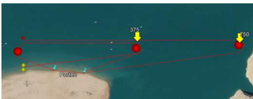
Cadetes, Juveniles, Senior y Veteranos (<65): 1 vuelta de 1500, 2 vueltas de 750 y 2 porteos Veteranos (>65) y Paracanoes (Cadete a Senior): 1 vuelta de 1500 y 2 vueltas de 750