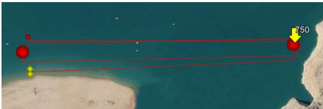
Infantiles: 2 vueltas de 1500m (sin porteo)