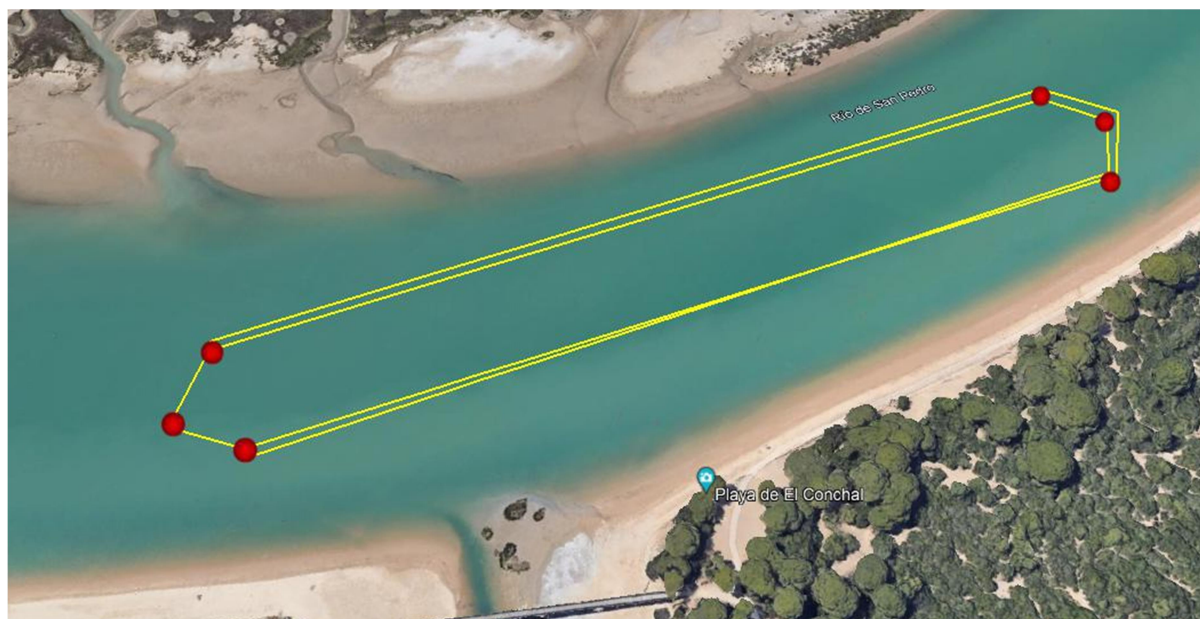
Recorrido 750m y 1500m (1 y 2 vueltas de 750m)