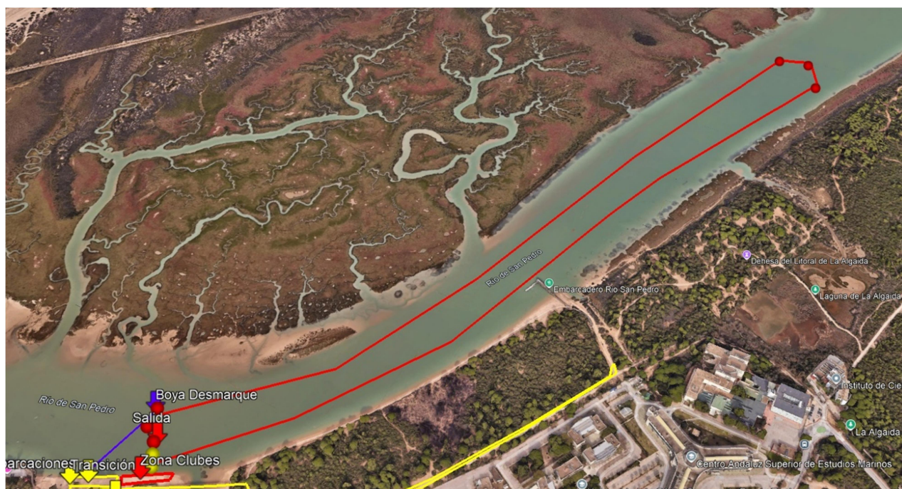
Recorrido 3000m (1 vuelta de 3000m)